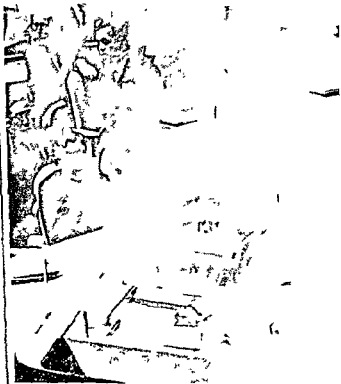
Before the United Nations (Song 67)